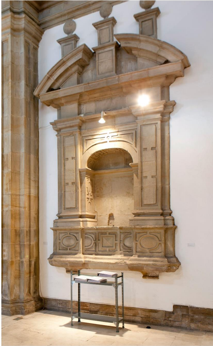
El proceso , 2018

Vista de la exposición, Yoes Museo Barjola, Gijón