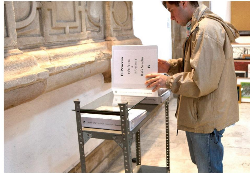
The Process , 2018

Exposition view, Yoes Barjola Museum, Gijón